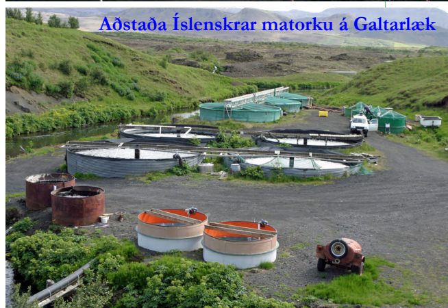
Aðstaða Íslenskrar matorku á Galtalæk