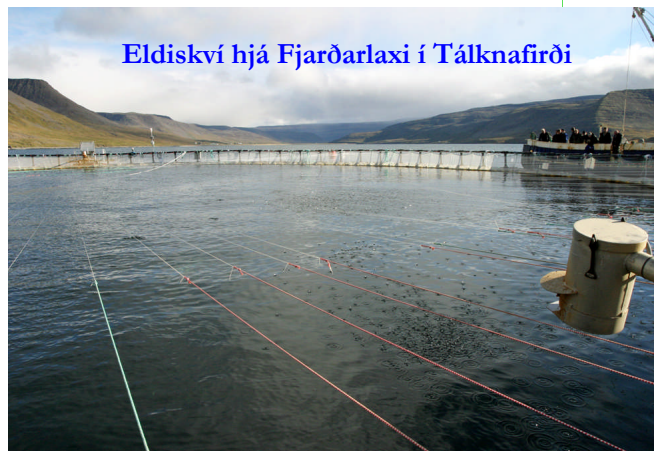
Eldiskví hjá Fjarðarlaxi í Tálknafirði

Upptalningin hér að ofan er ekki endanleg og eru nokkur fyrirhugaðar framkvæmdir sem eru komnar styttra á veg og verður vonandi tilkynnt um þær fljótlega.