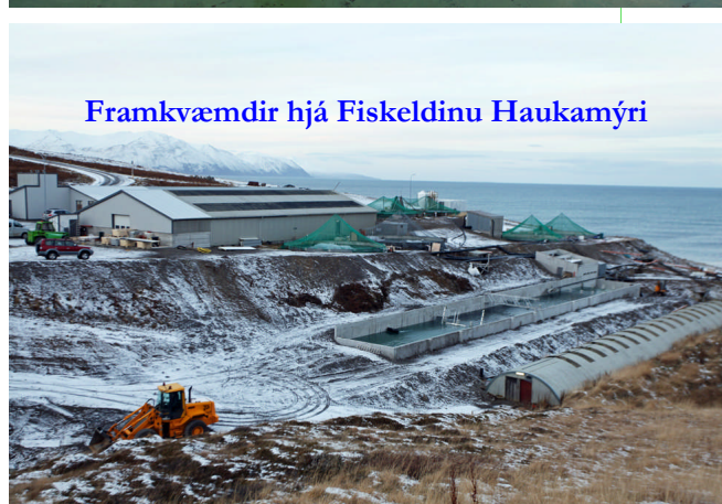
Framkvæmdir hjá Fiskeldinu Haukamýri