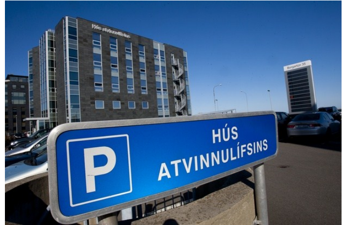
Fundarstaður, Hús atvinnulífsins, Borgartúni 35, 6 hæð.

Tímasetning: Fundurinn hefst klukkan 09:00 og gert er ráð fyrir að honum ljúki klukkan 17:00.